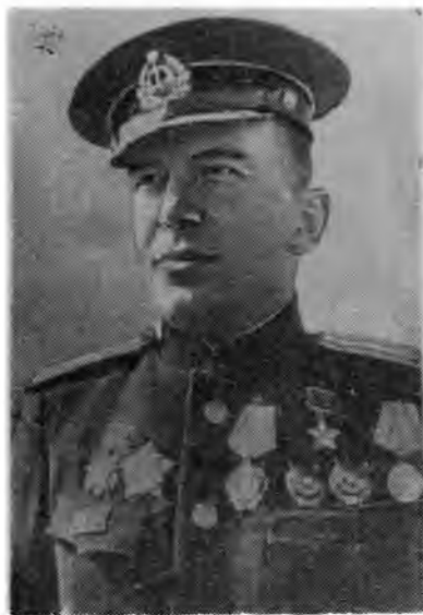
Герой Советского Союза гвардии капитан-лейтенант Б. П. Ушев.

Указом Президиума Верховного Совета СССР от 15 мая 1946 года Алексею Ивановичу Пестереву было присвоено звание Героя Советского Союза.