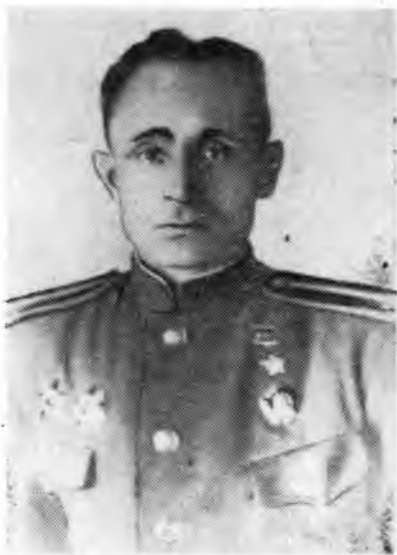
Герой Советского Союза старший лейтенант К. В. Оцимик.

Наши войска наступали на немецкий город Гинденбург. Передовые части, которые вели бои с противником на окраине города, попав под сильный огонь вражеских танков и артиллерии, залегли. Чтобы поддержать пехоту артиллерийским огнем, необходимо было немедленно вывести на передовые позиции расчеты противотанковых орудий. Вывести свою батарею на прямую наводку и уничтожить вражеские танки было приказано старшему лейтенанту Оцимику. Командир полка подполковник Угрюмов был уверен в его мастерстве и смелости. Теперь успех наступающих частей зависел от артиллеристов Оцимика, от того, на-