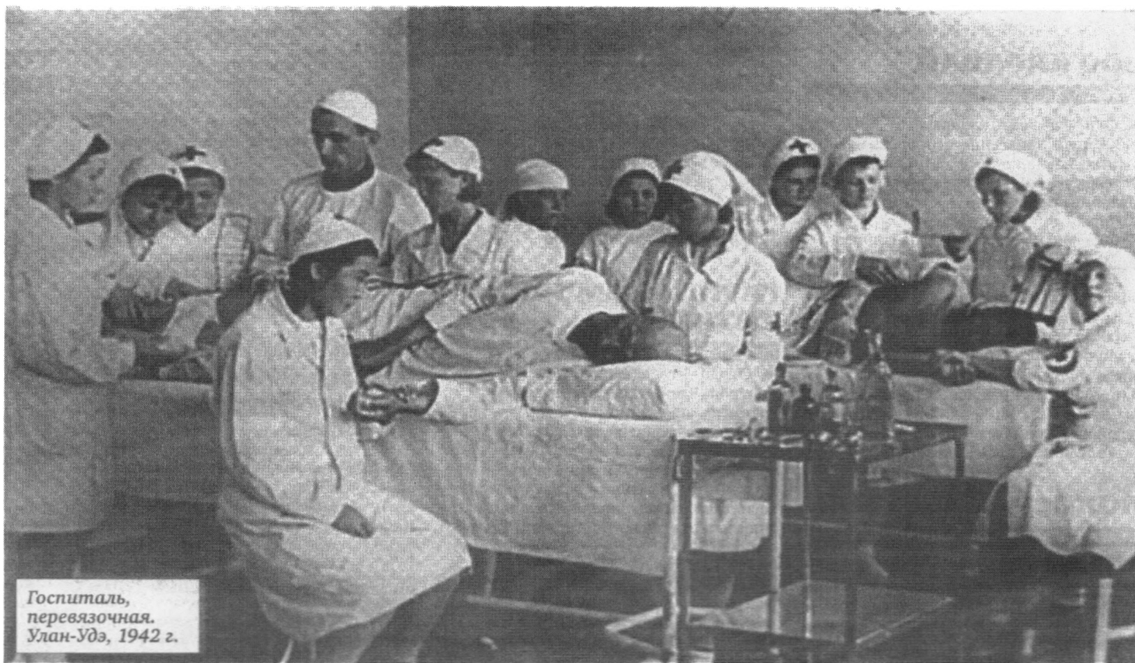
Госпиталь, перевязочная. Улан-Удэ, 1942 г.

В годы войны с фашистами Бурятия находилась в глубоком тылу. Сюда, как и в другие удаленные регионы, везли раненых. Бойцов с легкими ранениями ле-