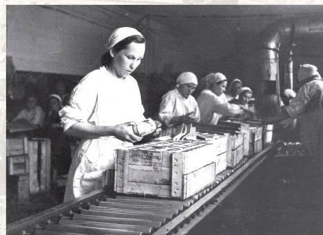
▼ Мясоконсервный цех.