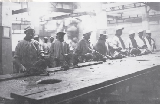
Мясоконсервный цех. ▼