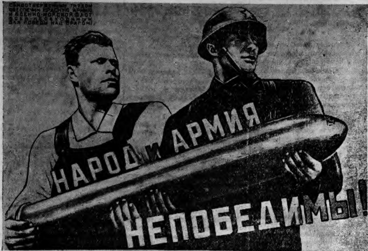
(Репродукция с плаката, выпущенного издательством «Искусство»). Худ. В. Норацкий.

Отечество в опасности. На нашу родину, созданную кровавым потом отцов и дедов и возвеличенную трудами нашего поколения, двинулся враг. Защита отечества собственной грудью—дело не только бойцов, командиров и политработников, а всего советского народа. Прочь все, что не для победы, что мешает победе, ослабляет ее!