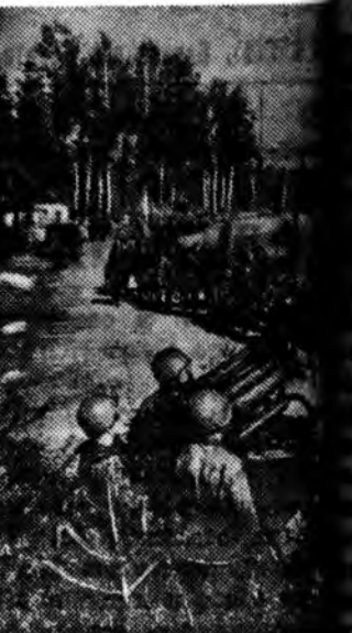
ДЕЙСТВУЮЩАЯ КРАСНАЯ АРМИЯ. НА СНИМКЕ: ...

Взрывая фавтически Финляндию в свою колонию, выкачивая на нее все, что можно — лес и масло, скот и целлюлозу, — германский фашизм довел страну до последней степени истощения, до полной экономической разрухи.