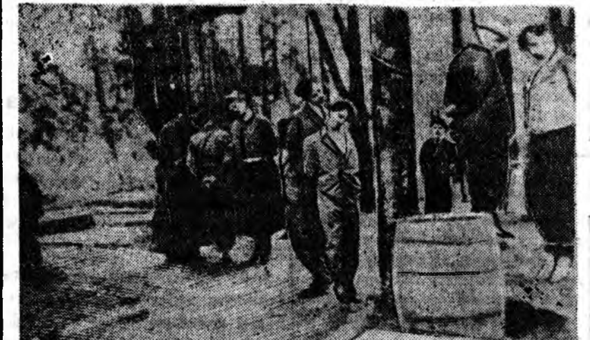
Таинными картинами портят села и города Югославии, поработанные фашистскими бандами германских авиачиков.

нах должны быть заняты немцами — сотрудниками гестапо. Чтобы не вызывать недовольства и ненависти у населения, инструкции предлагает проявлять внешнюю «сущность» к населению, однако, одновременно подчеркивается, что потребности Германии в рабочей силе должны быть удовлетворены любой ценой. Местные власти обязаны поощрять отправку рабочих в Германию. Относительно стран, входящих в группу «С», в инструкции говорится, что технические и экономические потребности Германии определяют военный, политический и геополитический контроль над этими странами. Хабе пишет, что в эту группу входят такие страны, как Испания, Болгария, Венгрия и, возможно, Италия. Германским солдатам в этих странах предлагается избегать носить германскую форму. Они обязаны вести активную пропаганду фашизма. Германские офицеры должны поощрять использование германских рабочих в военных отраслях промышленности стран, входящих в группу «С», и сообщать о случаях, когда германским рабочим отказывают в приеме на работу.